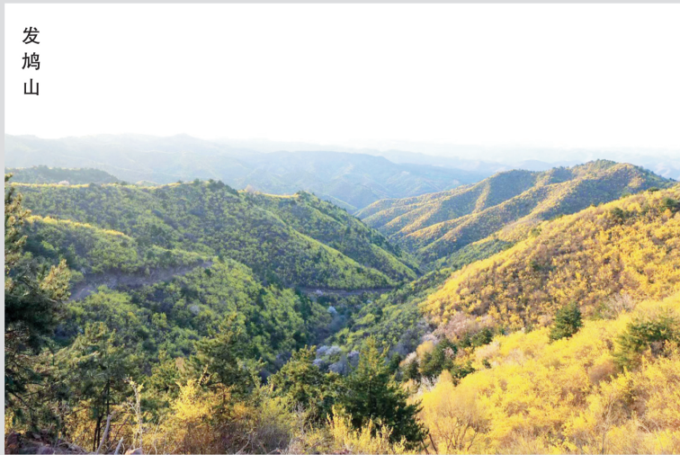
刊头题字： 苗志杰