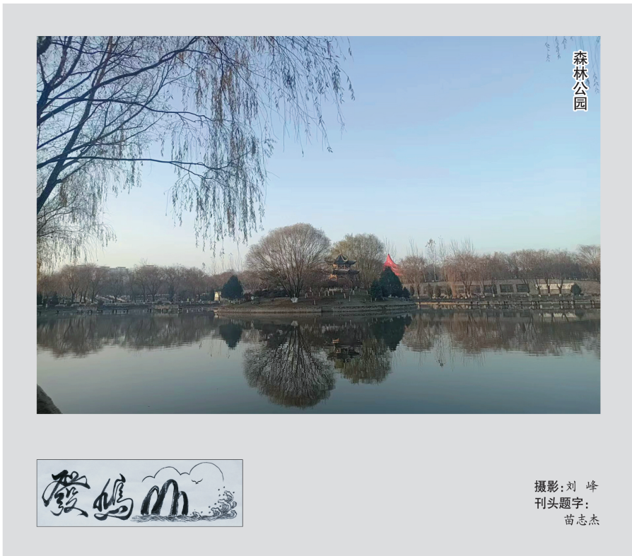
刊头题字： 苗志杰

硬生生的 被风剥离了母体 西山上的落日 舍不下这世间的小精灵 用余晖染红了叶的躯体 只为来年 在这纷繁的世界里 更好的相认 本该是 从枝头滑落 隐身于根下 等待春天的呼唤 换上崭新的绿装 护卫在花的身旁 在暖日的照耀下 扮靓世界 让人间充满爱 该死的风 却如此轻佻 裹挟着可怜的小东西 四处流浪